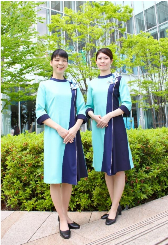
【新制服デザイン着用イメージ】

新しい制服の導入により、5周年という節目に新しい気持ちでお客様をお迎えするとともに、お客様にあべのハルカス美術館での非日常体験を楽しんでいただけるよう高品質なサービスの提供に努めてまいります。