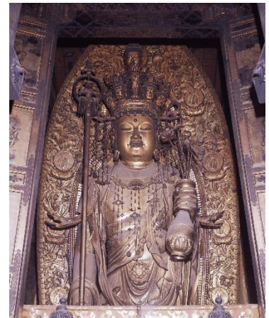
▲長谷寺 十一面観世音菩薩立像

長谷寺では僧侶のご案内で本尊十一面観世音菩薩立像を特別拝観、さらに本坊・大講堂を特別に見学させていただきます。