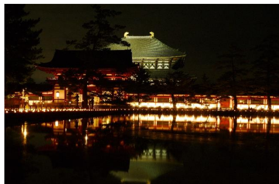
▲東大寺 大仏殿ライトアップ