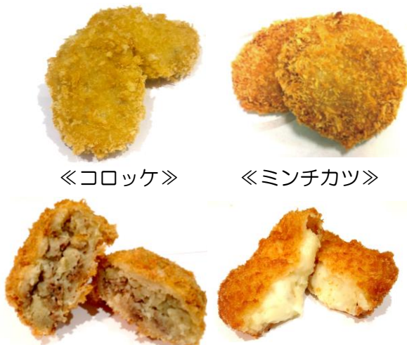
《コロッケ》 《ミンチカツ》 《大阪すき焼きコロッケ》 《チーズコロッケ》