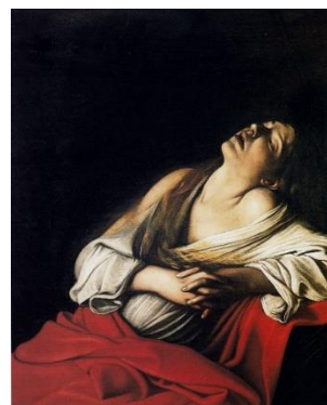
《マグダラのマリア》 1606年 個人蔵