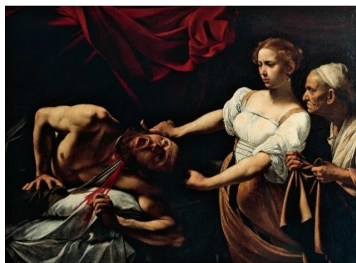
《ホロフェルネスの首を斬るユディト》ミケランジェロ・メリージ・ダ・カラヴァッジョ 1599年頃 バルベリーニ宮国立古典美術館 per concessione del Ministero dei Beni e delle Attività Culturali e del Turismo

開催趣旨：17世紀バロック絵画の創始者で、イタリアが誇る天才画家、ミケランジェロ・メリージ・ダ・カラヴァッジョ (1571-1610)。光と闇の交錯する劇的な絵画空間、迫真的な描写は多くの追隨者を生みました。その栄光とは裏腹に、破滅的な人生が伝説ともなりました。わずか60点強とされる現存作品の中から、日本初公開を含む約10点と、彼に影響を受けた画家たちの作品が一堂に集結します。