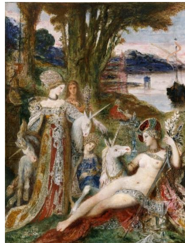
《一角獣》 ギュスターヴ・モロー 1885年頃 ギュスターヴ・モロー美術館