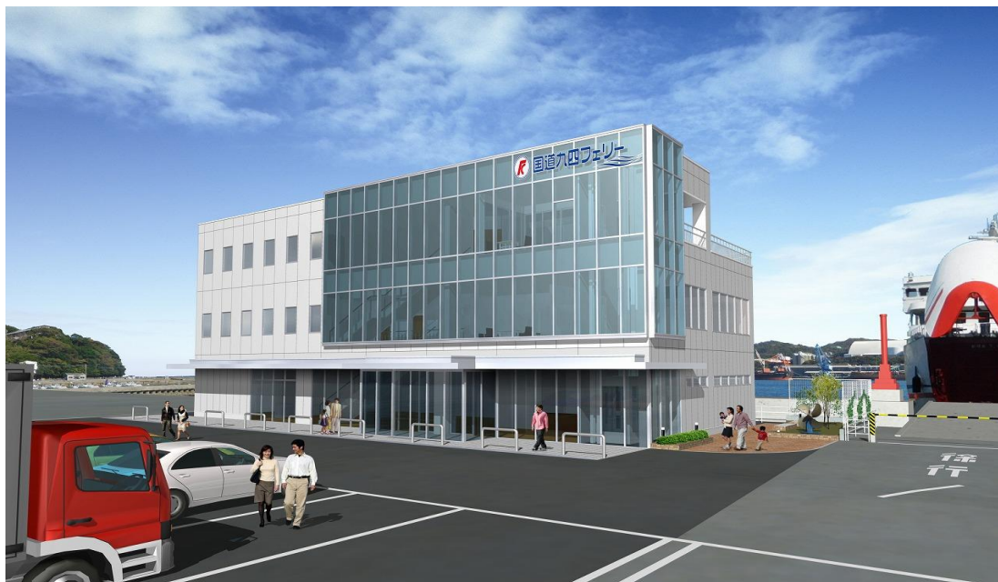
新ターミナルビル外観（イメージ）

また、2012年にカーフェリー「速なみ」、2016年に「遊なぎ」を新造するなど、船体の大型化やバリアフリー化などを積極的に進め、今後もカーフェリーの新造を計画してまいります。