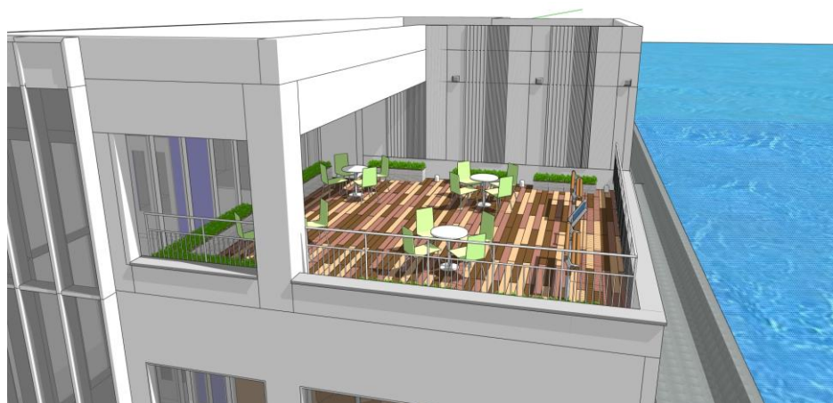
3階展望デッキ（イメージ）