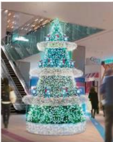
⑤あべのハルカス16階ロビー