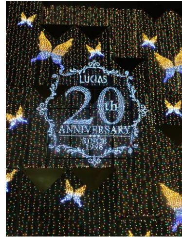
アポロビル・ルシアスビル