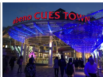
あべのキューズモール