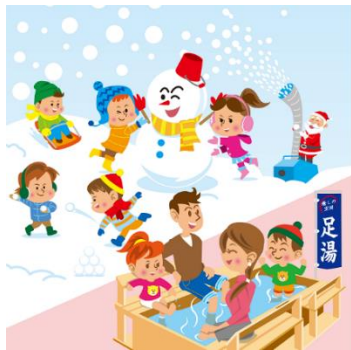
Welcomingアベノ・天王寺 ウィンタープレゼント2018 イメージイラスト