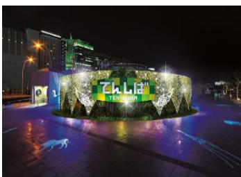
天王寺公園エントランスエリア てんしば