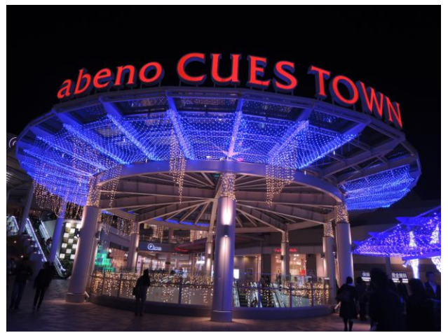
あべのキューズタウン