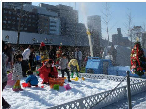
過去の雪あそびの様子