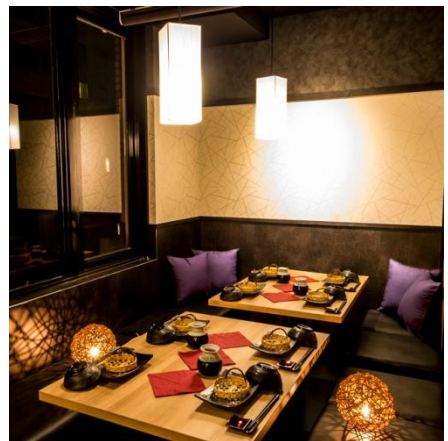
個室イメージ （チーズタッカルビ×和食バル 肉の東郷）