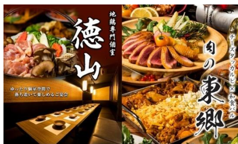
地鶏専門個室徳山・ チーズタッカルビ×和食バル肉の東郷（ロゴ）