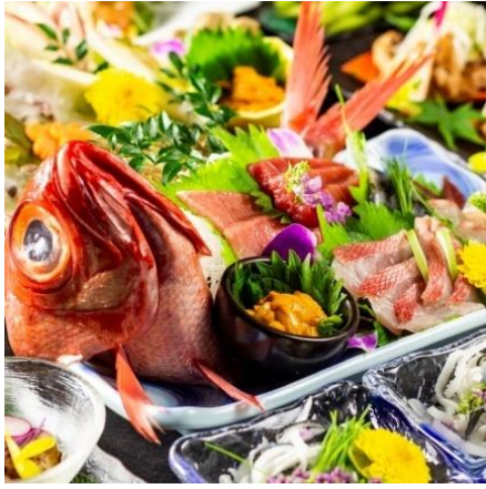
鮮度にこだわった宴会コース8品 3,499円（税別）