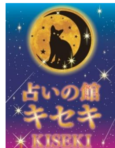
占いの館キセキ （ロゴ）