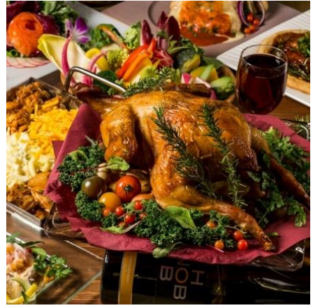
チーズタッカルビ&シュラスコ 3時間飲み放題付2,999円（税別）