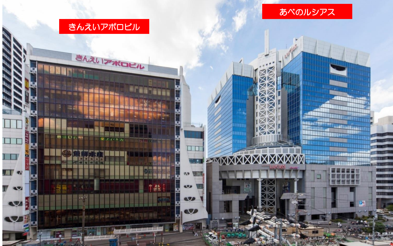
きんえいアポロビル

シネマ、グルメ、ショッピング、サービス、フィットネス、大型書店等約110店舗が揃った大型商業ビル