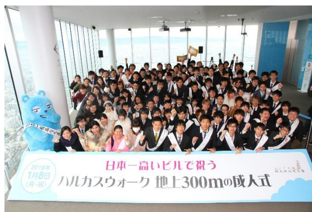
参加者の記念撮影の様子 (第5回ハルカスウォーク)