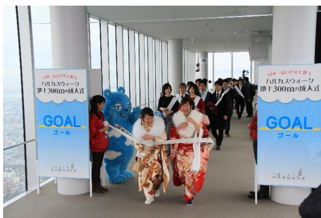
ゴールする新成人 (第5回ハルカスウォーク)

今後も「あべのハルカス」では皆様にお楽しみいただけるイベントを開催して参ります。