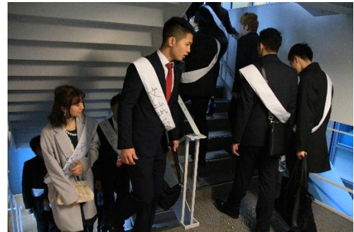
【階段を登る参加者】