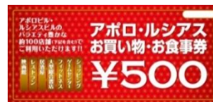
アポロ・ルシアスお買い物・お食事券