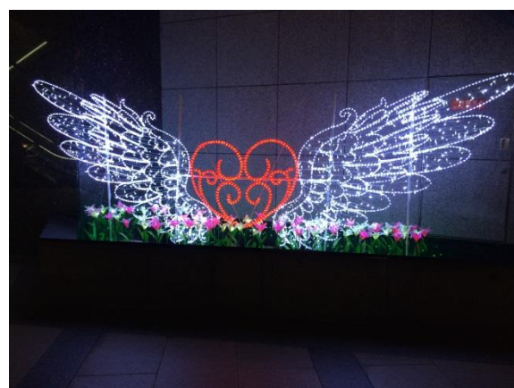
「つばさ」のインスタ映えスポット