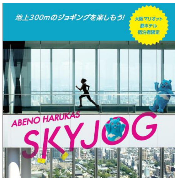
『ABENO HARUKAS SKY JOG』イメージ図

ぜひ、「地上300mのジョギングコース」で日常では味わうことのできない体験をお楽しみください。詳細は別紙をご覧ください。