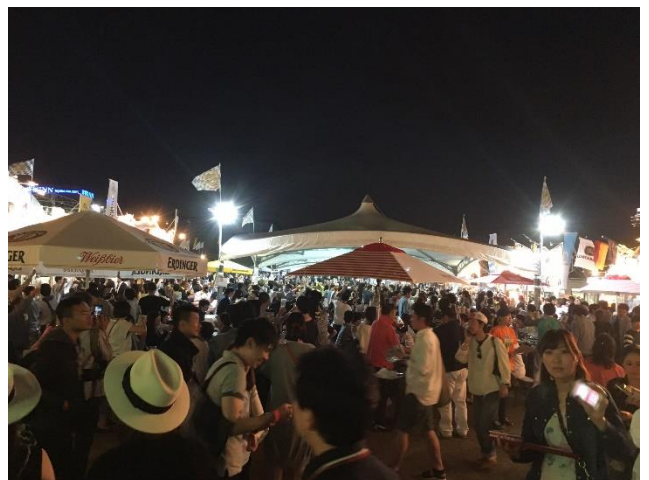
オクトーバーフェストの様子（2016年開催時）