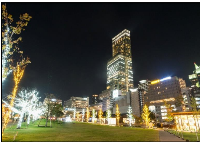
てんしばのイルミネーション（2017年開催時）

2018年3月29日（リニューアルオープンから約2年6か月）には総来園者が1,000万人を突破しました。その後も年間400万人を超えるペースでたくさんの方にご来園いただいております。地域の皆様だけでなく、関西圏広域の方々にお楽しみいただいております。今後も当社は「てんしば」が皆様に親しまれ、愛される場所になるよう、努めてまいります。