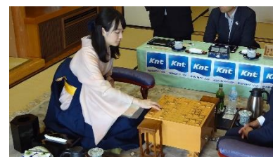
前回企画時の対局の様子

■旅行代金:和室おひとり様34,000～183,500円(夕朝食付1室1～5名利用)