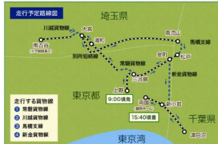
貨物路線5線をつなぐオリジナルルート