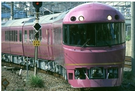
お座敷列車「宴」

KNT-CTでは、今後もグループ各社の連携を図りながらそれぞれの強みを活かし、お客様に支持される商品開発に取り組んでまいります。