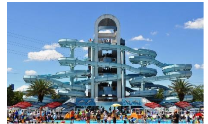
▲橿原市総合プール

当社八木案内所(営業時間：9:00～19:00年中無休)にて プール入場券発売 7/14～9/2 ～7/13はお得な前売り券も!