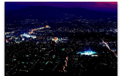
▲若草山山頂の夜景