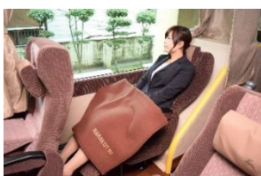
★足元までゆったり

奈良—新宿線、五條—新宿線、奈良—横浜・京成上野・「東京ディズニーリゾート®」線の3路線で、毎日運行している夜行高速バスです。（詳細は、別添パンフレットをご覧ください。）