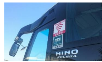
★充電用コンセント、無料Wi-Fi完備でスマホも快適