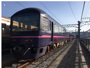
お座敷列車「華」

今回はお客様の期待にお応えして、貨物線を走行するオリジナルルートを変更し、またシリーズで初めて夜に走行するコースとなっています。東海道線から見える夕焼けや、高島貨物線を通る真っ暗な倉庫街など夜だからこそその車窓を貸し切りのお座敷列車よりお楽しみください。