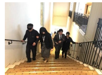
アイマスクを使った手引き研修の様子