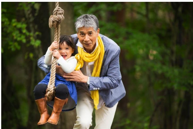
星野リゾート リゾナーレハケ岳(孫旅イメージ)