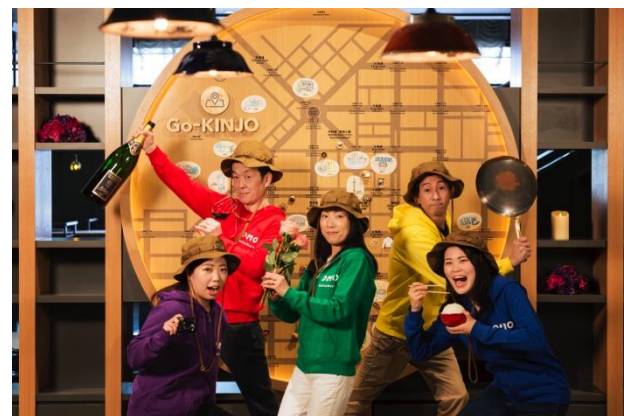
星野リゾート OMO7 旭川 (街の案内ガイド「OMOレンジャー」イメージ)

特別カタログ「クラブツーリズム×星野リゾート」創刊号は上記4商品に加え、「美食」「夫婦旅」「一人旅」など、様々な旅のニーズに合わせた旅行商品(全て、星野リゾートの宿泊施設を利用)も掲載しています。今後もクラブツーリズムと星野リゾートは、両社の強みを生かしながら、お客様にとって“行ってみたい”と思っていただけるような旅を考え、お客様にご提案をまいります。