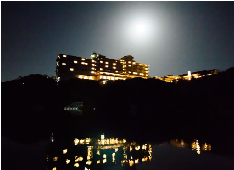
水面に鏡のように映るホテルは穏やかな英虞湾ならではの光景