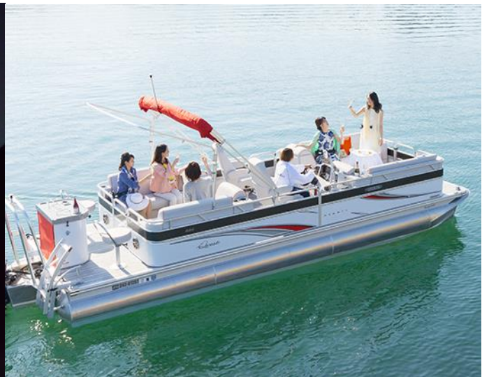
ラグジュアリーでコンパクトな船体