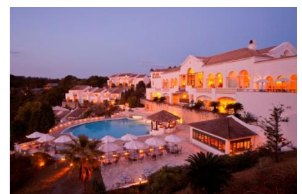
テラスからホテルの夕景