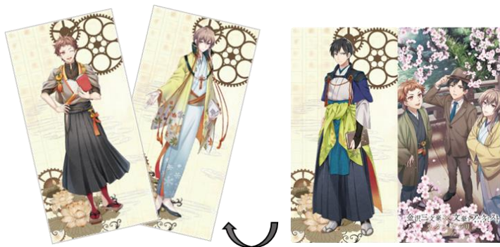
当企画限定クリアチケットホルダー(表面)

■旅行代金の一例：金沢東急ホテル(食事なし/おとな・子ども1様/サービス料込・税金別)の場合 15,000円(2名1室) / 12,000円(3名1室) (食事なし/おとな・子ども1様/サービス料込・税金別)