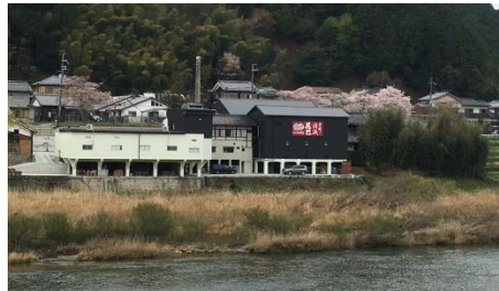
【美吉野醸造(株)の蔵】