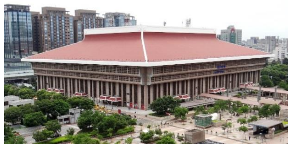
台北駅 外観