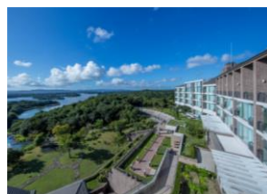
ホテル近鉄 アクアヴィア伊勢志摩