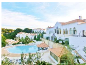
海辺ホテル プライムリゾート賢島