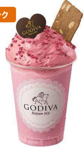
<ゴディバ> ムースショコラ クランベリーストロベリー 661円