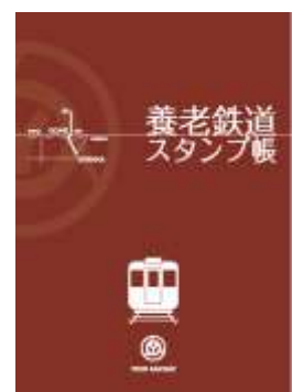
スタンプ帳（イメージ）