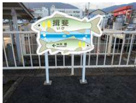
揖斐駅ご当地駅名標（イメージ）