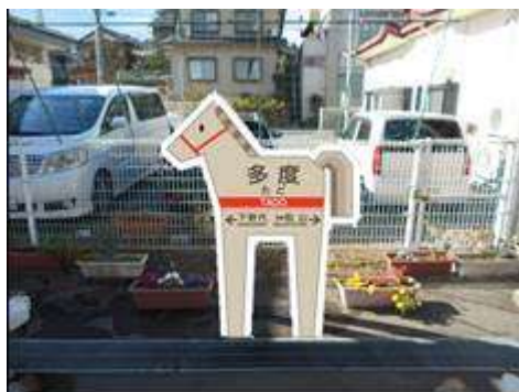
多度駅ご当地駅名標（イメージ）

沿線7市町に在住する小学校1年生を対象に、養老鉄道が乗り放題の年間無料パスを配布します。