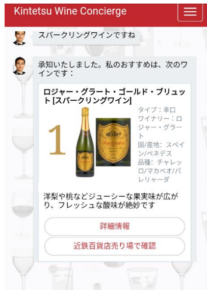
商品提案イメージ