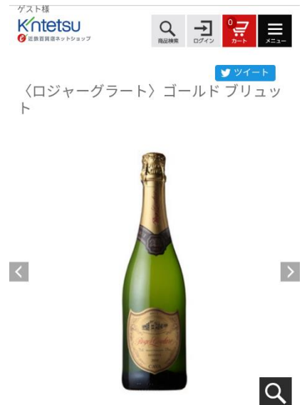
近鉄百貨店ネットショップ