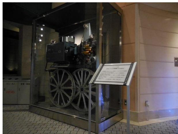
35mmフィルム映写機(シネマサロン内)