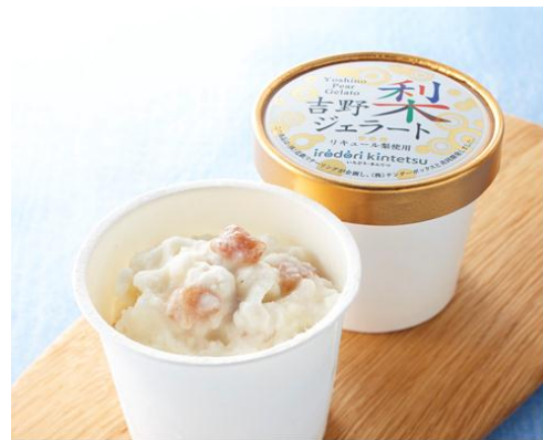
吉野梨ジェラート