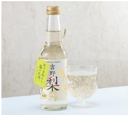
スパークリング・リキュール吉野梨