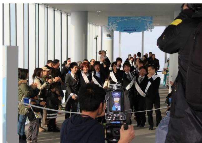
ゴールする新成人 (第3回ハルカスウォーク)