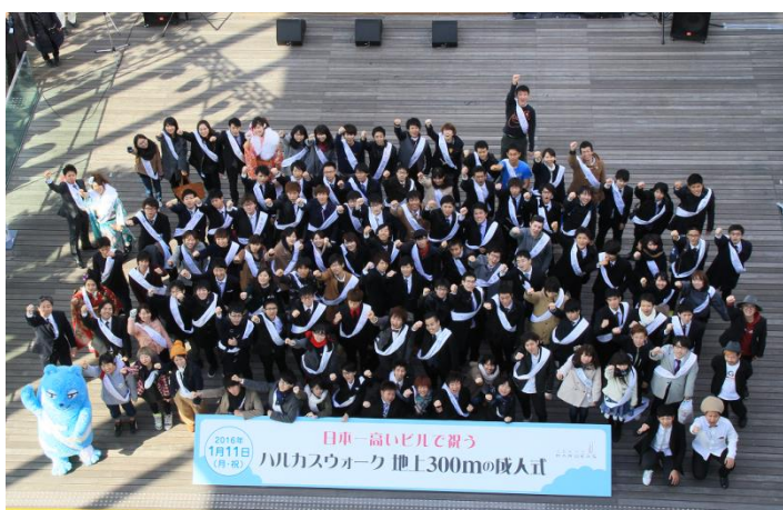
参加者の記念撮影の様子 (第3回ハルカスウォーク)