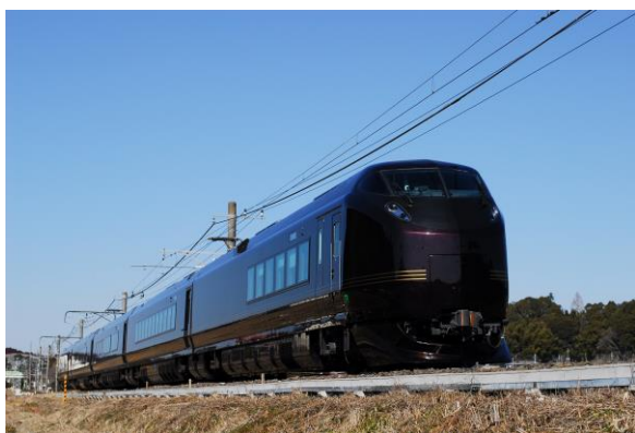
<なごみ車両イメージ>