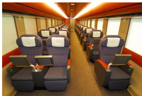
<なごみ車内イメージ>

当社ではこの車両を11月26日に貸し切り、ツアーを企画しました。午前東京・上野を出発し、群馬県安中市の碓氷峠鉄道文化むらでお楽しみいただき、上野まで帰ってくる日帰りの行程です。これまでこの車両を利用するツアーは1泊2日が多く、このたび日帰りツアーを企画することで、気軽にご参加いただけるのが魅力です。