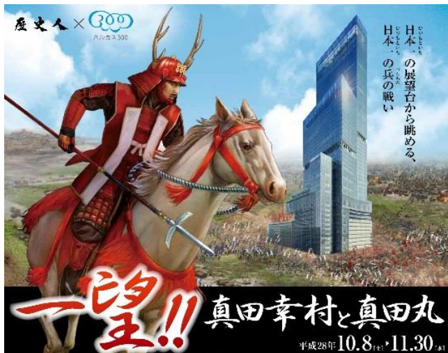
イベントメインビジュアル