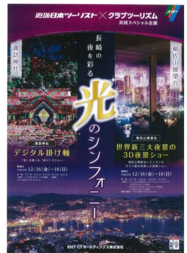
イベント告知ポスター（イメージ）

上記イベントについては、東京・日本橋にある長崎県のアンテナショップ「長崎館」でもご案内しております。またJR九州管内各駅においても、ポスター掲示される予定です。