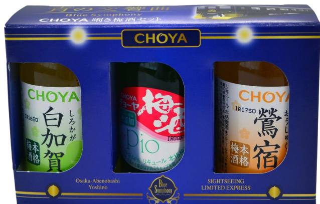
青の交響曲（シンフォニー）オリジナルパッケージ酎き梅酒セット