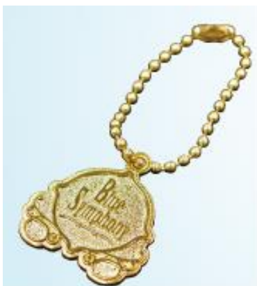
オリジナルチャーム