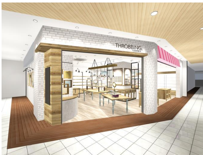
「スローピングコスメプラス」店舗外観イメージ

今般、第一号店となる上本町店を、平成28年10月上旬、近鉄大阪上本町駅地下改札外にオープンします。詳細は別紙のとおりです。