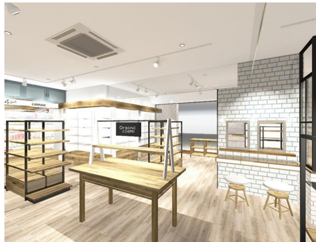
店内内装とパウダーコーナー（正面右）イメージ