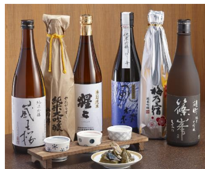
「吉野の地酒 飲み比べセット」 「御所・葛城の地酒 飲み比べセット」