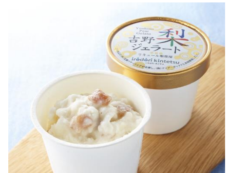
「吉野梨ジェラート」

奈良県平群町でイタリアンレストラン「mamma(マンマ)」を運営する「 tenderボックス」と、「近鉄リテーリング」が共同開発したオリジナルジェラートで、近鉄リテーリングの地域商品ブランド「irodori kintetsu」の商品です。地元大淀町・五條市産の梨果肉を使用し、さわやかな梨の香りと果肉のボリューム感が楽しめます。