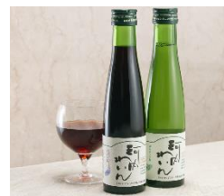
「河内わいん（赤・白）」