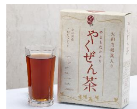
「やまとたかとり やくぜん茶」

「くすりの町」高取町で栽培された大和当帰葉を始め、奈良県産の漢方素材をブレンドしたお茶です。当帰は身体を温める作用があるとされ、様々な漢方薬に用いられています。自然の恵みを惜しみなく詰め込みました。