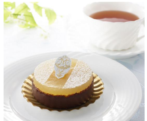
大阪マリオット都ホテル 「季節のオリジナルケーキセット」

滑らかなミルクチョコレートのクリームに薄焼クレープ生地のアクセント、バニラの香りを纏った果実感たっぷりの洋梨ジュレを重ねました。コーヒーもしくは紅茶をセットしてご提供いたします。