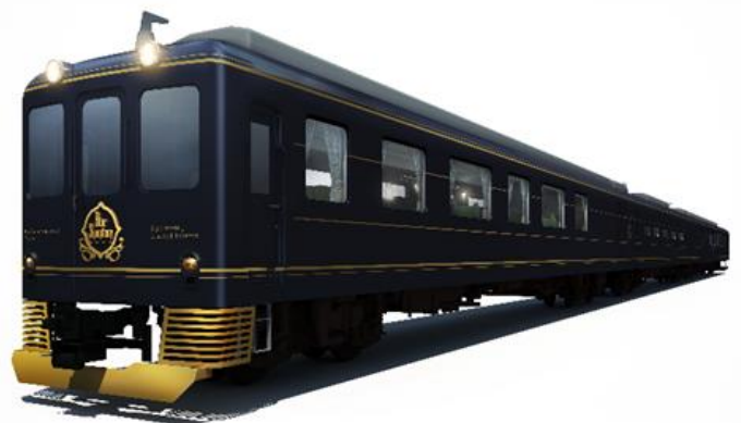
観光特急「青の交響曲（シンフォニー）」外装 (イメージ)