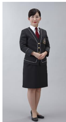
ジャケット着用時

車内サービスを担当する専属アテンダントの制服は、観光特急「青の交響曲（シンフォニー）」のコンセプト「上質な大人旅」に相応しいシックなデザインとしました。ジャケットは黒の生地に「青の交響曲（シンフォニー）」のエンブレムと、外装のラインイメージに合わせた金のボタンをあしらいました。車内ではホテルラウンジサービススタッフをイメージしたシンプルで清潔感のあるスタイルでお客様をおもてなしいたします。