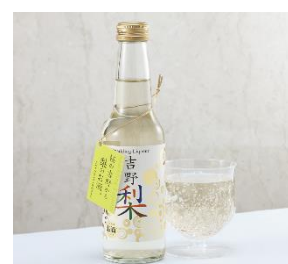
「スパークリング・リキュール吉野梨」

近鉄リテーリングの地域商品ブランド「irodori kintetsu」の商品です。