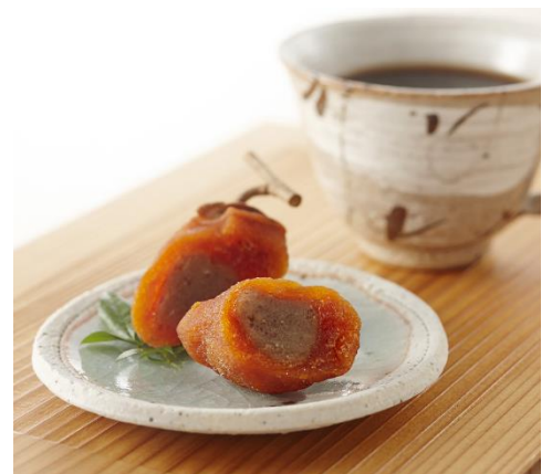
柿の専門いしい 「西吉野の柿スイーツセット」

素朴な味わいを持つ西吉野特産の法蓮坊柿を丁寧に干し、甘さ控えめの国産渋皮入りの栗あんをいっぱい詰めてみました。ほっこり懐かしい甘さに干し柿のわずかな渋味が重なり「郷愁」を感じます。2013年には観光庁が選ぶ「旅のきっかけになる究極のお土産」に選ばれています。コーヒーもしくは紅茶をセットしてご提供いたします。