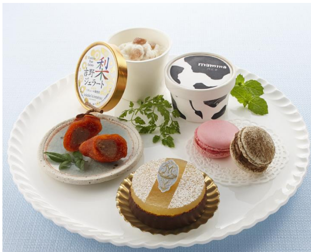
車内で提供するスイーツ

お買い求めいただいたメニューは、座席や2号車のラウンジスペースでお召し上がりいただけます。詳細は別紙のとおりです。