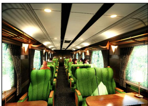
座席スペース（1・3号車、イメージ）