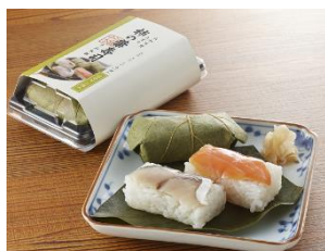
みざさ中谷本舗「柿の葉寿司」

葛城高原の麓に位置する「高松牧場」の、しぼりたての新鮮なジャージー牛乳を使ったモッツアレラチーズで、オリーブオイルとハーブ塩を添えてご提供いたします。