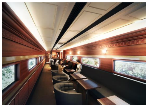
ラウンジ車両（2号車、イメージ）