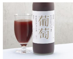
「地元ワイナリーの国産ぶどうジュース」

南河内周辺地域のワイナリーの国産ぶどうから作るジュースです。果実由来の濃厚な味で、お子様だけでなく大人の方にもお薦めしたいメニューです。