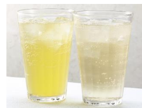
「シンフォニー・ハイボール」 左：下北山村育ちのジャバラ 右：吉野梨