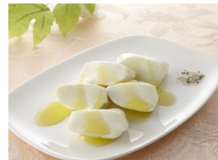
ラッテ・たかまつ 「葛城高原のモッツアレラチーズ」