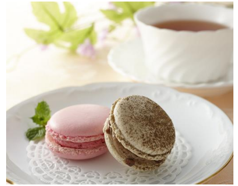
La peche (ラ・ペッシュ) 「マカロンセット」

地元だけでなく、遠方からも多くの方が訪れ、繁忙期の午後には主なメニューが売り切れるほど人気の吉野郡大淀町の洋菓子店「La peche (ラ・ペッシュ)」。地元産の日干番茶を使った香ばしい番茶味と甘酸っぱいきいちご味のマカロンです。コーヒーもしくは紅茶をセットしてご提供いたします。