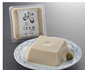
林とうふ店「吉野葛入り ごま豆腐」