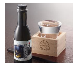
「梅乃宿 純米大吟醸 1合瓶 オリジナルラベル（吉野杉柀付）」

芳醇で心地よい味わいの、葛城の酒蔵、梅乃宿酒造の純米大吟醸をオリジナルラベルの1合瓶をご用意いたしました。高級国産木材として知られる吉野杉で作ったオリジナル杉柀をセットしてご提供いたします。