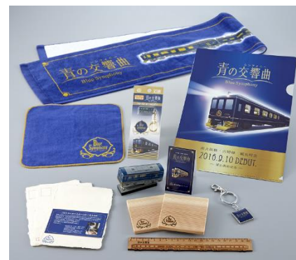
「青の交響曲（シンフォニー）」 オリジナル鉄道グッズ