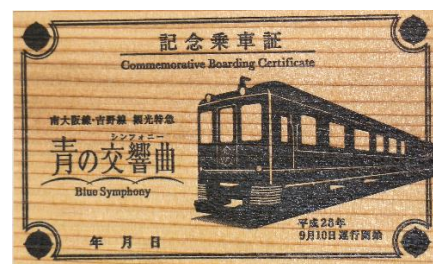
吉野杉材製 運行開始記念乗車証

吉野山観光協会等では「青の交響曲（シンフォニー）」運行を記念して「青の交響曲（シンフォニー）キャンペーン」を平成28年9月10日（土）から平成29年3月25日（土）まで実施します。記念乗車証を吉野山の協力店舗や旅館にお持ちいただいた場合、割引や粗品等の特典を受けることができます。