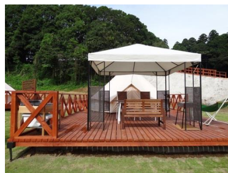
<グランピング施設>

*グランピング・・・グラマラスキャンピングと言われ、高級ホテル並みの豪華で快適なサービスが受けられる新しいキャンプ施設。