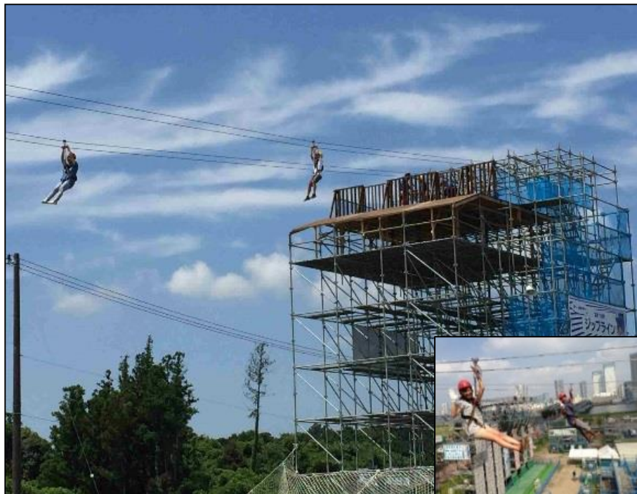
ジップラインスタート台 イメージ写真