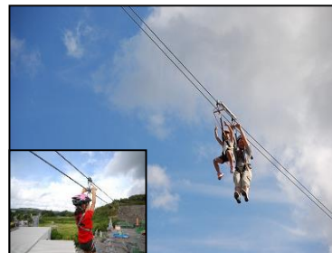
ジップライン滑走 イメージ写真