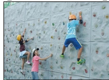
ミニボルダリング イメージ写真