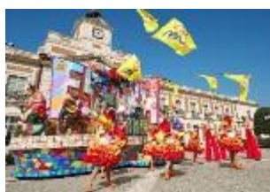
パルケエスパーニャパレード 「エスパーニャカーニバル “アデランテ”」