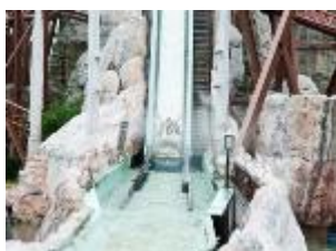
スプラッシュモンセラー