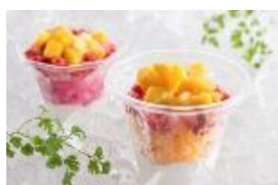
トロピカルロックアイス マンゴー/巨峰 各 500 円