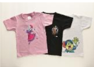
キャラクターTシャツ 1,750 円～