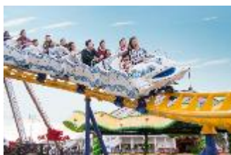
アトラクション 「キディモンセラー」