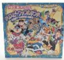
クリスピーワッフルサンド 1,100 円