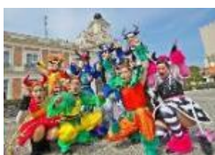
ストリートミュージカル 「エンシエロ！」