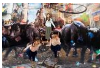
アトラクション 「3Dトリックツアー」