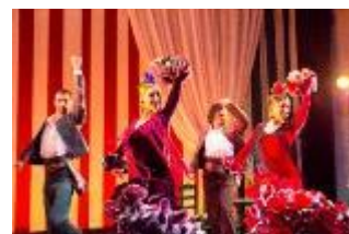
フラメンコショー 「フィエスタ・デ・セビーリャ」