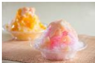
フルーツかき氷 マンゴー/ピーチ 各 600 円

園内のレストランやカートワゴンでは、ふわふわかき氷に贅沢なトッピングで仕上げたフルーツかき氷や、サクサク食感のポップランチと口の中でプチプチ弾けるコーティングジュースをトッピングした新食感ソフトなど、こだわりの夏スイーツが登場。冷たいスイーツの食べ比べはいかが？