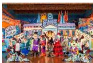
キャラクターショー 「ドンキホーテのアー・ペー・ セー・デー・エスパーニャ！」