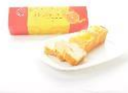
志摩スペイン村オリジナル オレンジケーキ 900 円