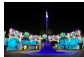
光と音のファンタジア 「イサベルの光」