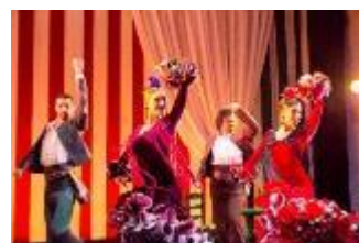
フラメンコショー 「フィエスタ・デ・セビーリャ」