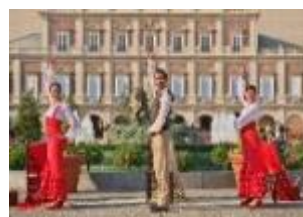
夏休み限定 ストリートパフォーマンス