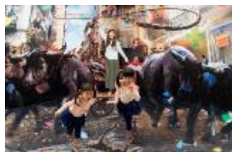
アトラクション 「3Dトリックツアー」