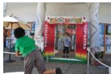
トマト当てゲーム