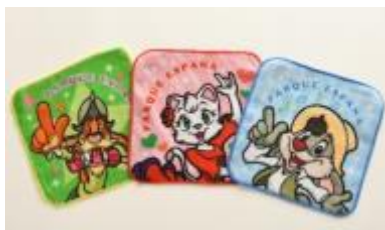
キャラクターミニタオル 3 枚セット 850 円

夏の人気キャラクター商品ミニタオルセットやTシャツをはじめ、新アトラクション「キディモンセラー」がデザインされた新商品「クリスピーワッフルサンド」、志摩スペイン村オリジナルのオレンジケーキなど豊富に取り揃えております。