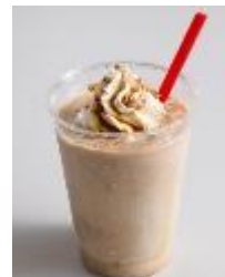
フラベリッチ キャラメルマキアート 450 円