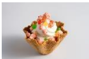
ポップランチソフト 480 円