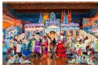
キャラクターショー 「ドンキホーテのアー・ベー・ セー・デー・エスパーニャ！」