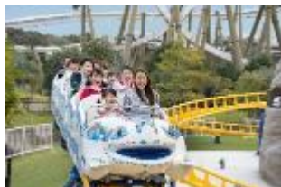
アトラクション 「キディモンセラー」