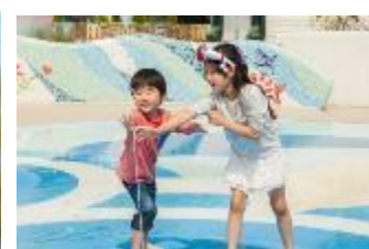
チャプチャプラグーン