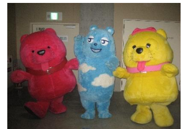
アベーノアベーノ、あべのべあ、ハレコ (画像左から)