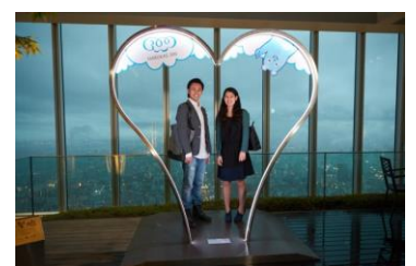
恋人の聖地モニュメント 「Harukas Heart」