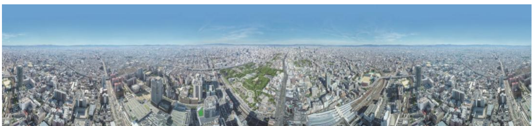
ハルカス300からの眺望

(URL: http://www.abenoharukas-300.jp/observatory/ )