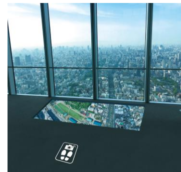
フォトスポットイメージ