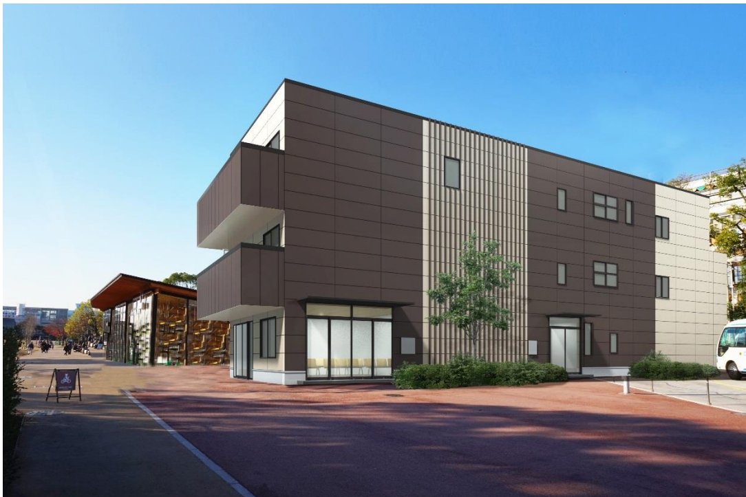
建物外観(完成予想CG)