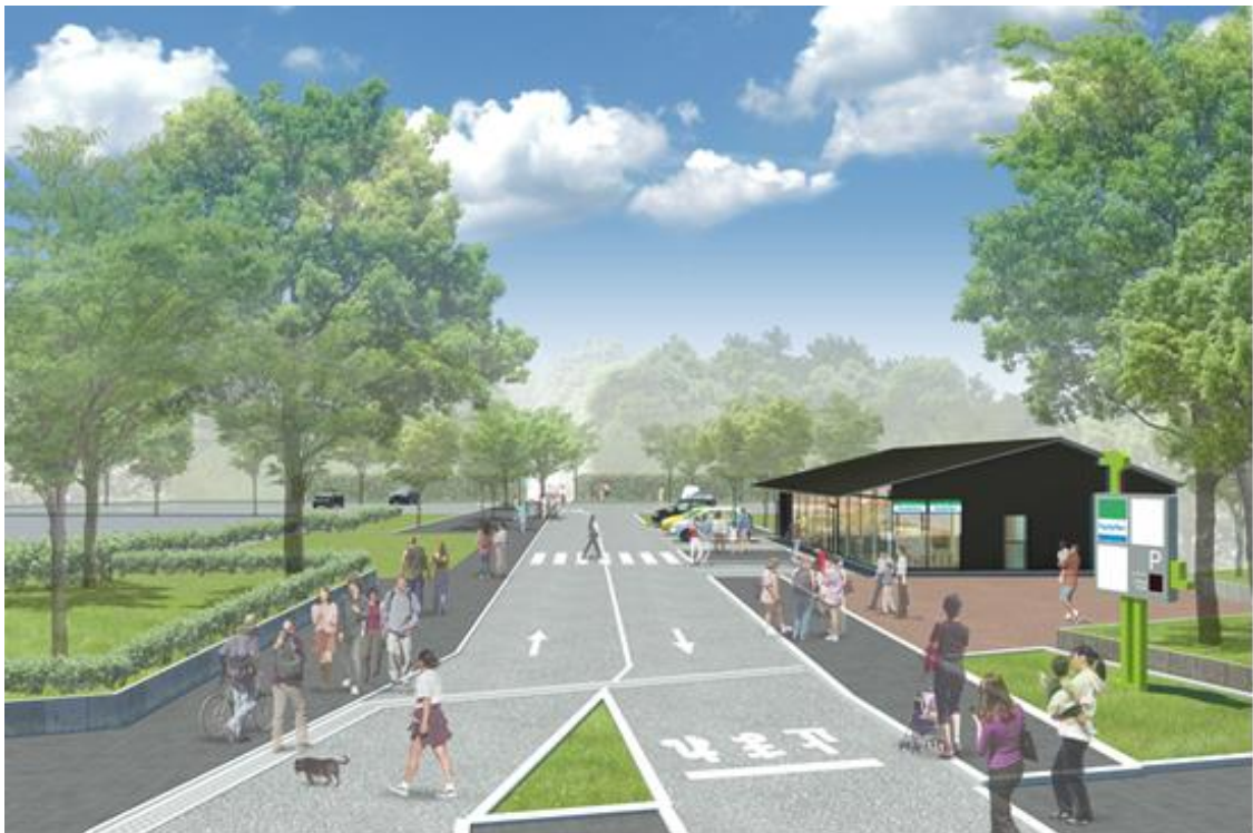
【茶臼山エントランスエリアCG】

真田幸村ゆかりの地、天王寺公園内にある茶臼山史跡周辺が改修工事を経て、3月19日（土）にリニューアルオープンします。当社が昨年10月より、天王寺公園エントランスエリア「てんしば」と共に大阪市から運営管理を受託している「茶臼山エントランスエリア」の遊歩道とも直結され、さらなる賑わいの創出が期待されます。そのオープンを記念して同エリアにて、「真田幸村本陣歴史トークショー」など、幸村を「楽しむ・感じる・学ぶ」イベントを開催します。なお、本イベントは天王寺区役所、天王寺観光協議会との共同開催です。また、本件につきましては、本日同時に大阪市からも報道発表されております。詳細については、別紙のとおりです。