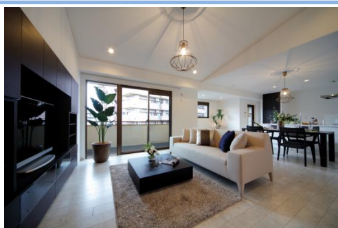
【リノベーション後室内写真(リビングダイニング)】