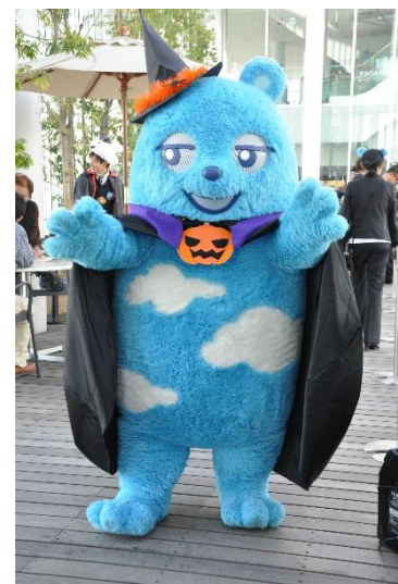
あべのべあ賞 受賞作品 うさぎうま 様