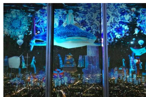
海遊館賞 受賞作品 川崎豊子 様