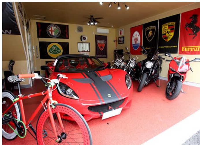
【ガレージハウス 利用イメージ】