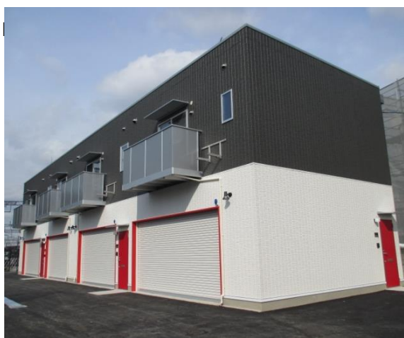
【ガレージハウス 外観】