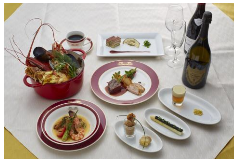
最高級客室「スイート」(2~4号車)とフランス料理のフルコースディナー (※写真はイメージです)