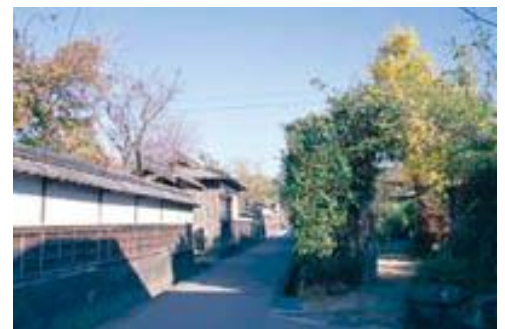
萩の町並み(イメージ)

観光ハイヤーで萩、秋吉台、秋芳洞観光後、新幹線のぞみ号グリーン車指定席にて名古屋へ。