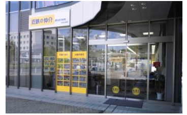
近鉄の仲介 白庭台営業所(奈良県生駒市)