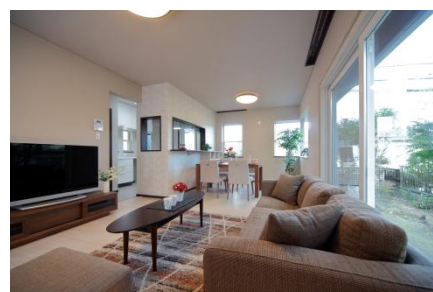
【リノベーション後室内写真】