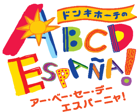
ドンキホーテの A B C D ESPAÑA ! ロゴ

彼らはスペインの事を何も知らない人々に「スペインのすべて A から Z まで」を紹介することに……。