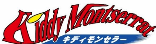
キディモンセラー ロゴ