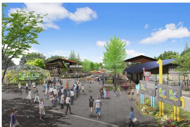
「ファミリーマート天王寺公園エントランス店」が出店する 天王寺公園エントランスエリア完成予想 CG